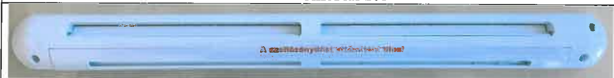
FENSTER AIR Plus Hygro 02